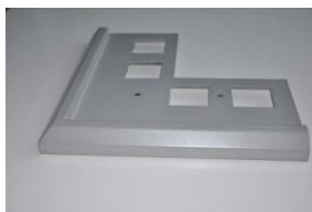
Narożnik 90 stopni DRIPCO